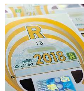
Kupon Dálniční známka na rok 2018

Státní fond dopravní infrastruktury, který má distribuci dálničních kuponů na starosti, už na konci loňského roku varoval před nákupem známek na poslední chvíli a nevyložil možné výpadky a riziko, že při hromadných nákupech dálniční známky na některých místech